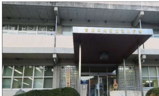
かもがわ図書館(加茂川庁舎内)