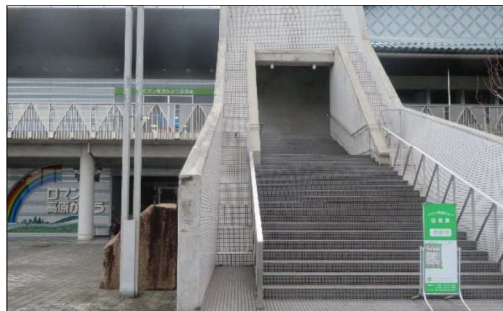
ロマン高原かよう図書館 (ロマン高原かよう総合会館内)